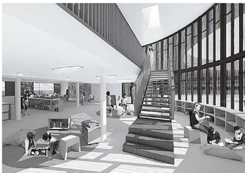
Los primeros 590 alumnos fueron elegidos al azar a través de un sistema de tómbolas. Ellos estudiarán de forma completamente gratuita.