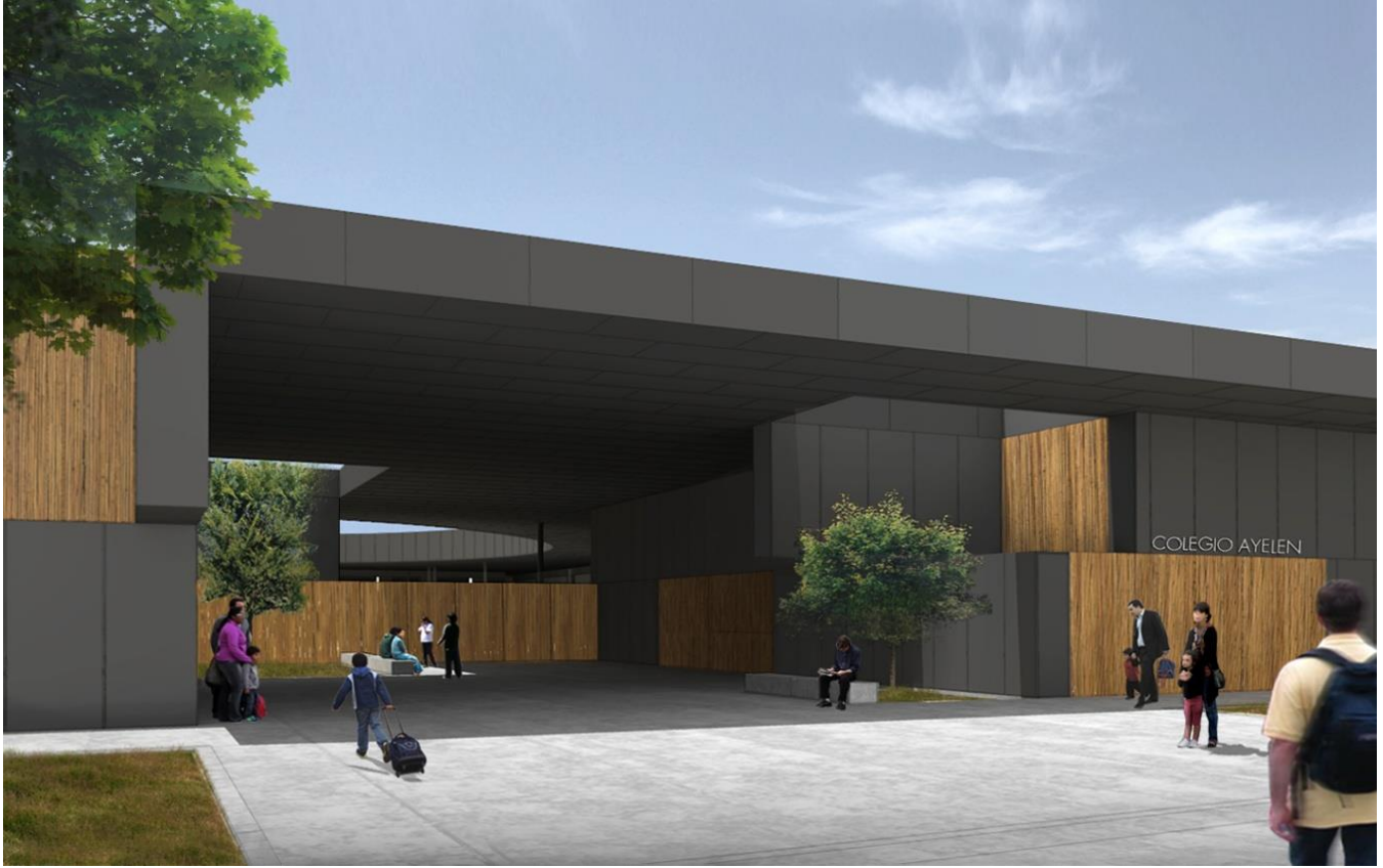
Frontis Colegio AYELEN